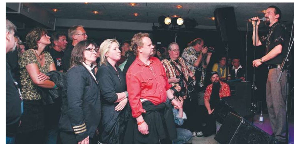
Jim's Combo gjorde ingen besviken men Barometern-OT:s recensent, Dennis Andersson, förväntade sig ännu mer av superkonstellationen.