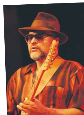
Stil och elegans med Mr Bo.

► Läs mer om festivalen på Mönsteråssidorna