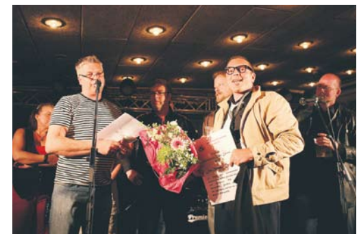
Joe Spinaci Combo vann årets upplaga av SCB.

Blues & Rootsfestivalen. Det var liksom inget snack om vem som skulle vinna årets Scandinavian Blues Contest. Joe Spinaci Combo vann både publikens och juryns hjärtan med sina färgstarka spelningar. Det innebär att dom får spela på finalpasset under nästa års Blues & Rootsfestival. Publikvådan Armadillo Blues får spela på dagen i stället.