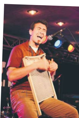
Tuffa Don Darlings.