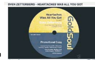
Länk på Barometern.se